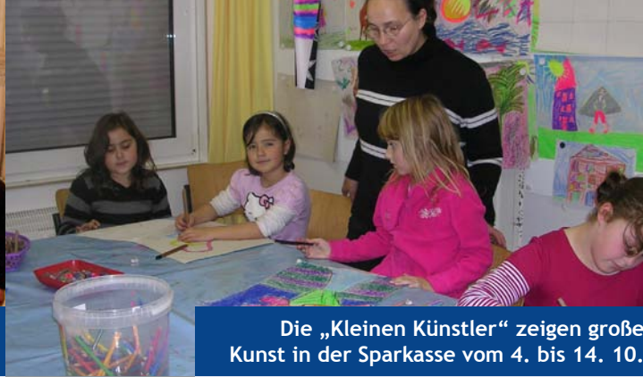
Die „Kleinen Künstler“ zeigen große Kunst in der Sparkasse vom 4. bis 14. 10.