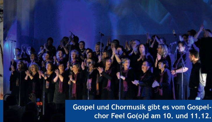
Gospel und Chormusik gibt es vom Gospelchor Feel Go(o)d am 10. und 11.12.