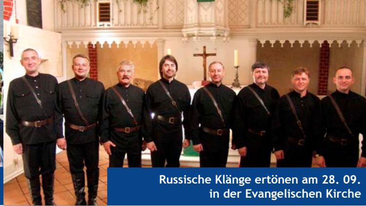
Russische Klänge ertönen am 28. 09. in der Evangelischen Kirche