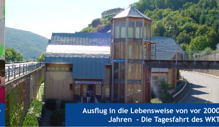
Ausflug in die Lebensweise von vor 2000 Jahren - Die Tagesfahrt des WKT