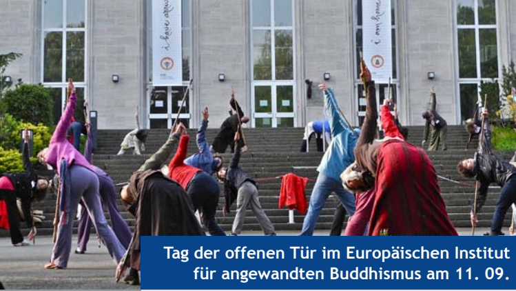
Tag der offenen Tür im Europäischen Institut für angewandten Buddhismus am 11. 09.