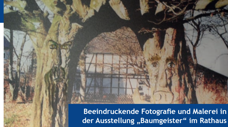
Beeindruckende Fotografie und Malerei in der Ausstellung „Baumgeister“ im Rathaus

Filmvorführung Das Fest der Freude im Disney-Park Florida von Herbert Waldhans Veranstalter: CBT Eintritt: frei