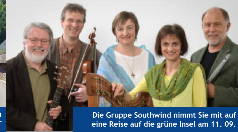
Die Gruppe Southwind nimmt Sie mit auf eine Reise auf die grüne Insel am 11. 09.

Do, 04.08. 14:30-15:30 Uhr Stadtbücherei im Bürgerhaus