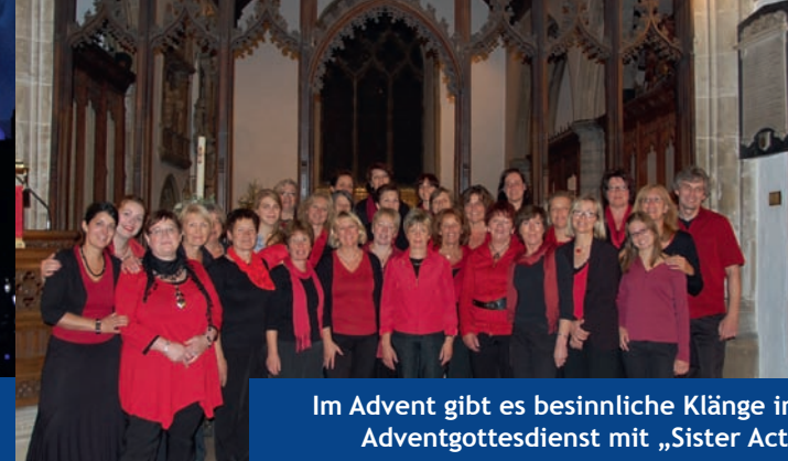
Im Advent gibt es besinnliche Klänge im Adventgottesdienst mit „Sister Act“

Weitere Informationen unter: www.w-k-t.org www.wktheater.de